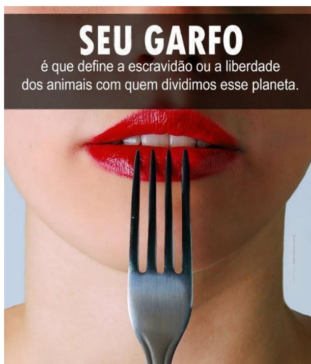
Figura 1 - Seu garfo

Para esclarecer esse processo de responsabilização individual, tem-se como exemplo duas campanhas publicitárias realizadas por grupos ativistas veganos.