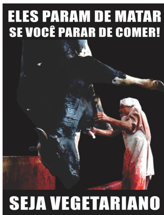
Figura 2 - Eles param de matar se você parar de comer!