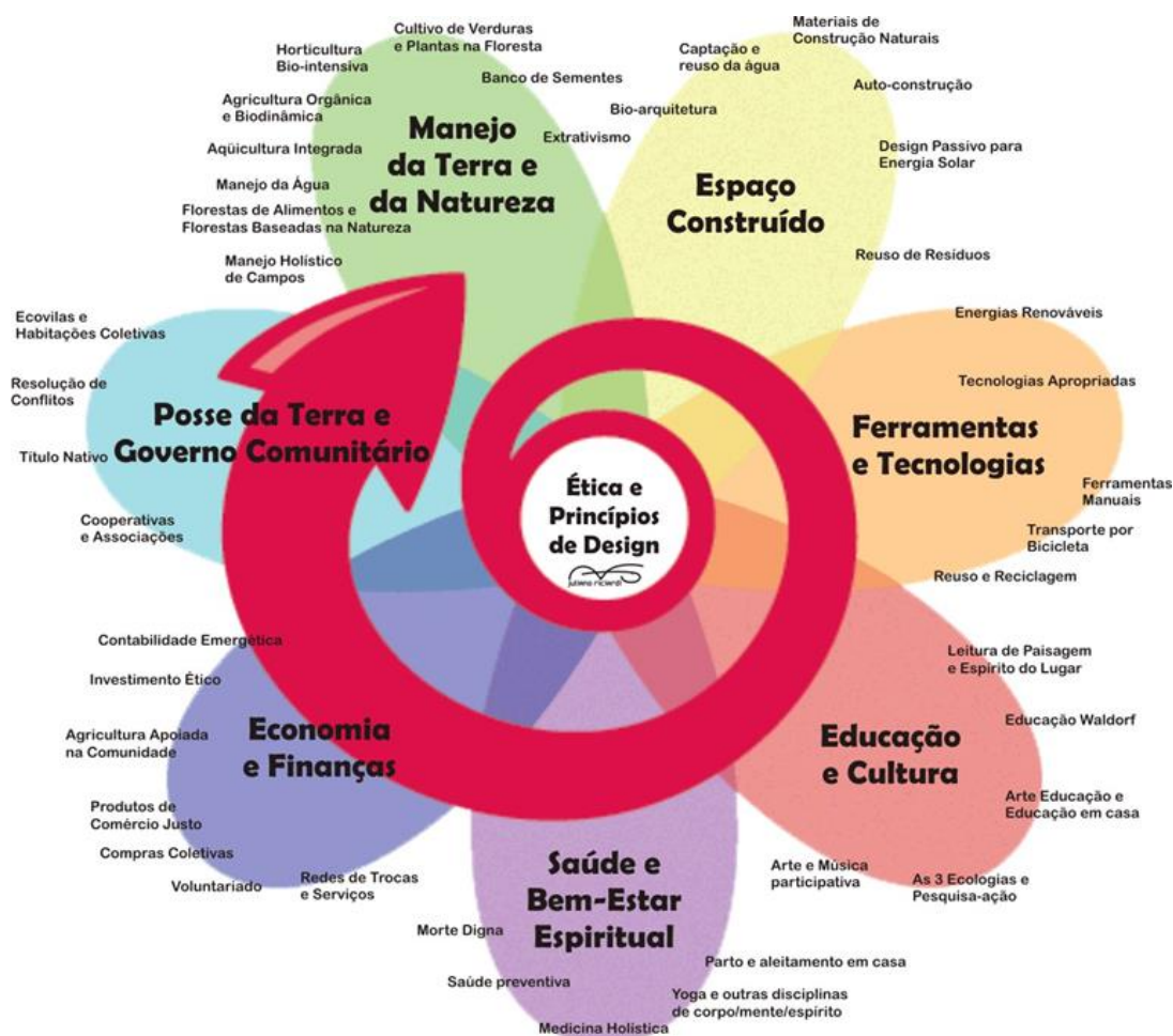
Figura 1 - Flor da permacultura